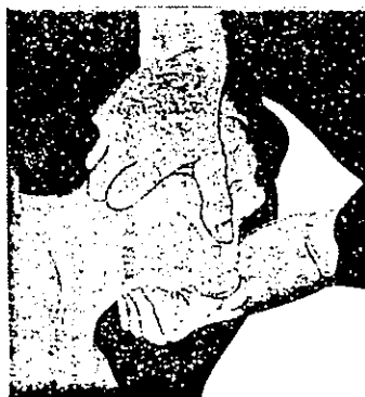
تصویر شماره ۱: باز کردن راه هوایی