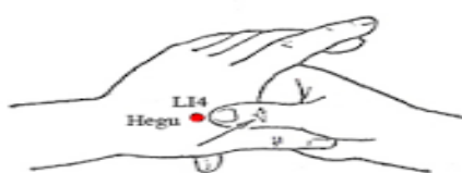
شکل ۲- محل نقطه هوگو

طب سوزنی محسوب می‌شود (۱۶ و ۱۵) و کاربرد آن نیز بسیار آسان‌تر است (۱۷). نقطه هوگو (LI4) مهم‌ترین نقطه ضد درد بدن است که در وسط نیمساز زاویه بین ماکارپ اول و دوم دست قرار دارد (۱۷). موقعیت این نقطه در جایی است که جریان انرژی به سطح پوست نزدیک‌تر بوده و می‌تواند به راحتی و به آسانی با فشار، سوزن یا سرمای شدید تحریک شود (۱۶).