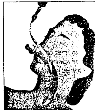
The laryngeal mask in place

تصویر شماره ۲: ماسک لارنژیال و روش استفاده از آن.