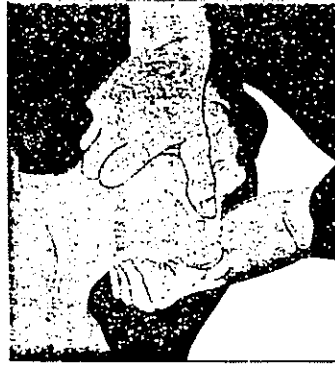
تصویر شماره ۱: باز کردن راه هوایی